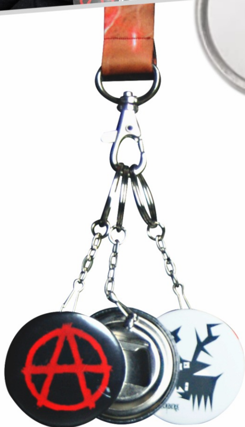
Otvíráky s klíčenkou