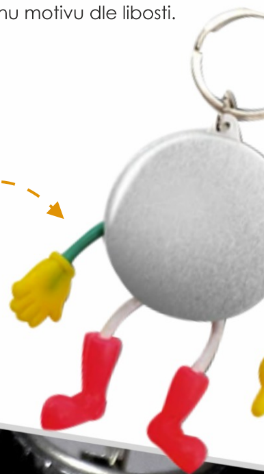
Button postavička s klíčenkou